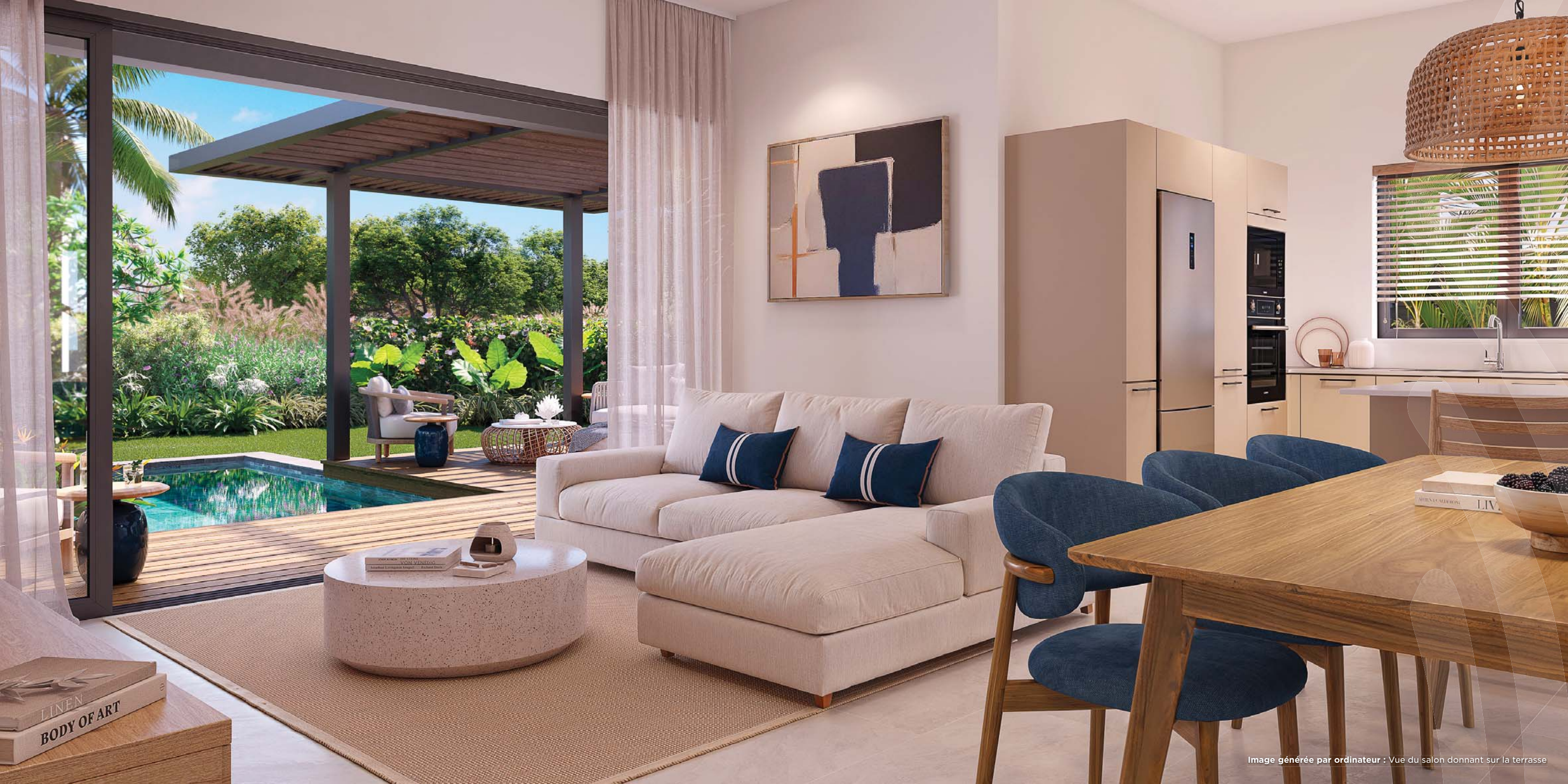
Image générée par ordinateur : Vue du salon donnant sur la terrasse